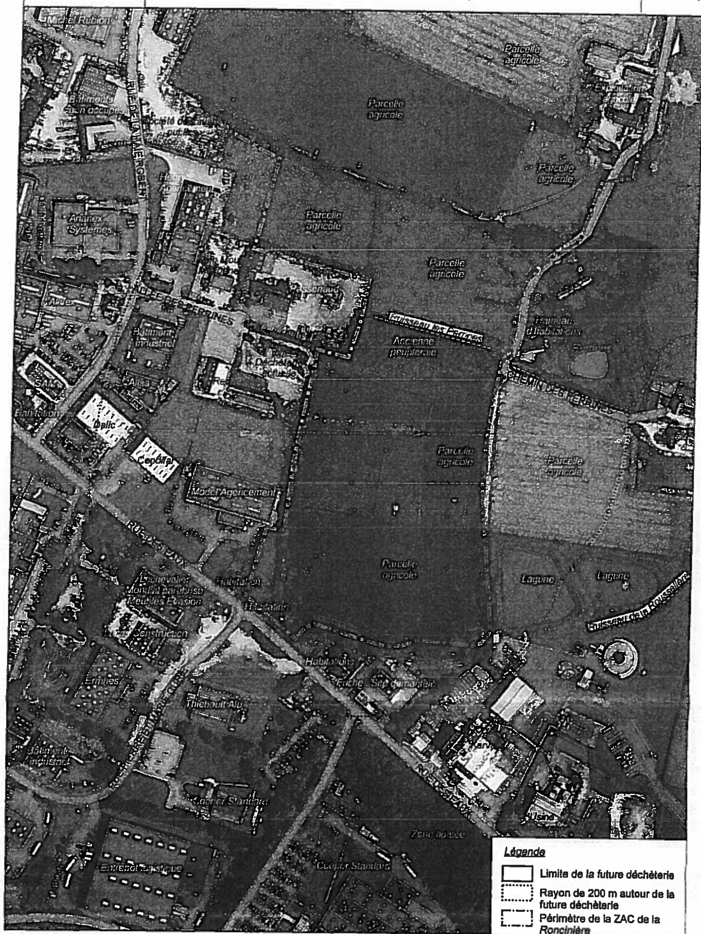
Figure 5 : Plan des abords de l'installation dans un rayon de 200 m